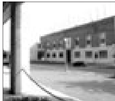
Il centro di Sabaudia

«CONSAPEVOLEZZA di sé e senso di appartenenza per fare comunità» è il titolo dell'incontro che si terrà questo pomeriggio, alle 17.30, nella Ludoteca Comunale in via delle Mimose a Sabaudia. Si tratta del terzo appuntamento del ciclo «Un Tema per te», nell'ambito del progetto «Donna Comunità», frutto delle attività e dell'impegno del settore dei Servizi Sociali del Comune di Sabaudia. Già partiti il progetto «...Contro le dipendenze» per i ragazzi del liceo scientifi-